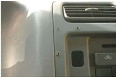
Montage gaten na demontage van accessoires