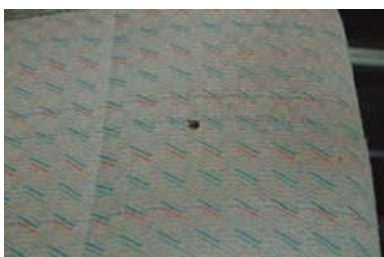
Brandgat in de stoelbekleding