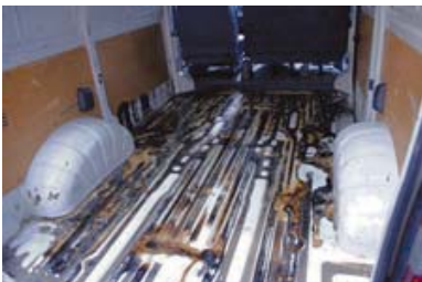
Door vloeistof aangetaste laadruimte