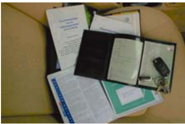
Documenten en sleutels

Kentekenbewijs deel 1 en 2, groene kaart, sleutels, handleidingen, onderhoudsboekje, instructieboekjes, declaratieformulieren en de tankpas moeten aan het einde van het contract worden ingeleverd.