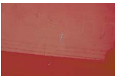
Lak beschadiging door verwijderen van reclame