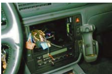
Gedemonteerde originele onderdelen

Alle in het contract genoemde accessoires moeten onbeschadigd gemonteerd zijn. Van accessoires moet het afneembare deel aanwezig zijn zoals een radiofront of een deel van een navigatiesysteem. Indien u zelf accessoires heeft gemonteerd mogen deze worden verwijderd mits er geen beschadiging of gaten in de auto achterblijven.