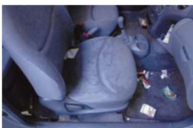
Vuil interieur wat reinigen noodzakelijk maakt