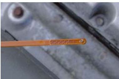
Te laag oliepeil