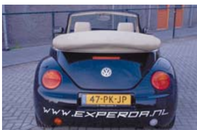
Niet verwijderde reclame

Na beëindiging van de contractperiode zal de reclame verwijderd moeten worden. Indien de reclame niet is verwijderd, er zichtbare verkleuring is opgetreden of dat bij het verwijderen van de reclame de lak is beschadigd zullen de kosten om dit te herstellen in rekening worden gebracht.