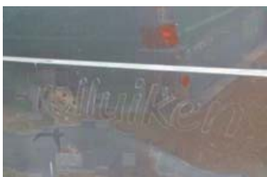
Verkleuring van de lak zichtbaar na verwijderen van reclame