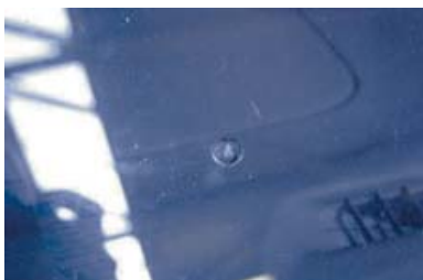
Ster en of put

Heeft u een ster of put in uw voorruit? Laat deze dan zo snel mogelijk repareren! U voorkomt hiermee dat de ster of put gaat scheuren en hierdoor de gehele voorruit vervangen moet worden. Reparatie van een ster of put is voor u kosteloos. Een voorruit vernieuwen kost het eigen risico.