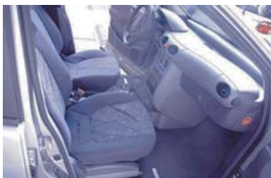
Scheuren en krassen in bekleding

Het interieur moet netjes worden onderhouden en er mogen geen beschadigingen zijn aan bekleding, dashboard en hemelbekleding. Hieronder valt ook hardnekkige geur of zware vervuiling waarvoor reinigen noodzakelijk is. Verwijdering van eigen accessoires die na demontage zichtbare beschadigingen achterlaten is niet toegestaan.