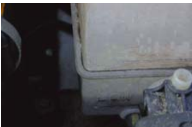
Te laag koelvloeistofniveau