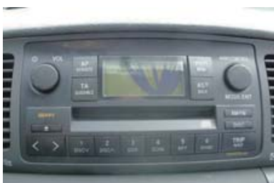
Beschadigde originele onderdelen